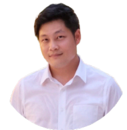
ปราศรัย เจตสันต์