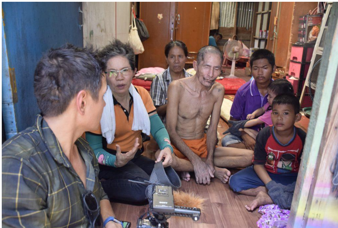
ชีวิตของ

ความสุขของครูประทีปคือการได้เห็นโอกาสทางการศึกษาของเด็กในชุมชนที่ด้อยโอกาสมากที่สุดของเมืองหลวงเท่าเทียมกับเด็กที่มี โอกาสดีกว่า “หลักสูตรห้องเรียนภาษาอังกฤษจะสอนร่วมกับแนวมอนเตสซอร์รี่ หากเราปลูกฝังตรงนี้ได้ โตขึ้นไปเด็กก็จะมีอนาคตที่ ดี ตอนนี้มีครูชาวออสเตรเลียมาวางหลักสูตรให้ เริ่มต้นทำมา 2 ปีแล้ว เพราะโลกเปลี่ยนแปลงอยู่ตลอด ถ้าหากเราอยู่แค่ประเทศ ไทย เราไปไม่รอด โดยเฉพาะเด็กยากจน หากจบแล้วไม่สามารถมีงานรายได้ดีก็จะกลับไปสู่วงจรอุบาทว์ (โง่ จน เจ็บ) แต่ถ้าหาก เด็กเก่งภาษาอังกฤษและคอมพิวเตอร์ เขาสามารถทำงานทั่วโลกได้โดยไม่ต้องจบอะไรสูง ยิ่งถ้าเป็นคนขยัน ซื่อสัตย์ ไปไหนก็มีแต่ คนอ้าแขนต้อนรับ หากเราสามารถวางรากฐานการศึกษาที่ดีให้กับเด็กได้ มันก็จะเห็นผลภายใน 10 ปี”