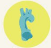
ลิ้นหัวใจ