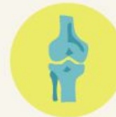
กระดูกและเส้นเอ็น