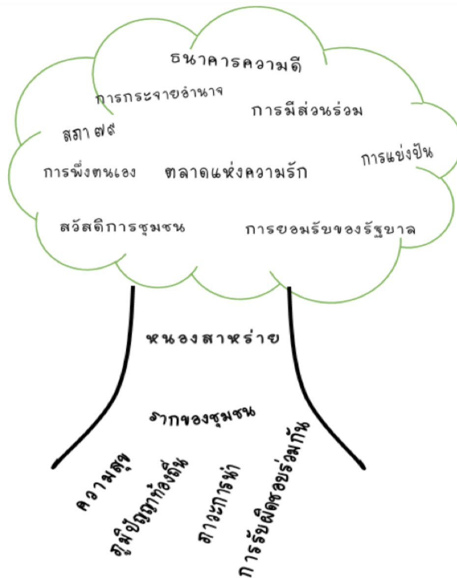
แผนผังแนวคิดชุมชนหน่อสาหร่าย

ชุมชนบริหารจัดการอย่างชาญฉลาด โดยสร้างความเป็นเจ้าของวิสาหกิจชุมชนร่วมกัน ผลกำไรกระจาย แก่สมาชิกทุกคน สมาชิกชุมชนจึงต้องรับผิดชอบร่วมกัน ประชุมอย่างสม่ำเสมอ เมื่องานชุมชนเข้มแข็งแล้ว ก็ ถ่ายทอดองค์ความรู้ให้แก่ชุมชนอื่นๆ โดยมีผู้สนใจเดินทางที่หน่อสาหร่ายไม่ขาดสาย ชาวบ้านภาคภูมิใจใน ชุมชนของตนเอง คนหนุ่มสาวกลับมาอยู่ในชุมชนมากขึ้นเรื่อยๆ จากที่แต่ก่อนย้ายไปทำงานในเมืองใหญ่ นอกจากด้านปากท้อง ชุมชนยังมีกิจกรรมเชื่อมสัมพันธ์อย่างสม่ำเสมอ เช่น ตลาดแห่งความรักซึ่งจัดขึ้นทุก เดือน ให้คนในชุมชนนำของในไร่นาหรือของที่ไม่ได้ใช้มาแลกเปลี่ยนกัน เหล่านี้มาจากวิสัยทัศน์ของผู้นำ ที่เข้าใจว่า ความสุขของมนุษย์ไม่ใช่แค่เรื่องปากท้อง แต่ชุมชนยังดูแลมิติอื่นๆ ทั้งด้านวัฒนธรรม ประเพณี ความสัมพันธ์ การเกื้อกูลกัน การส่งเสริมศักยภาพของคนในชุมชน