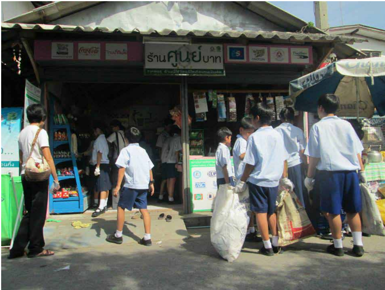
ร้านศูนย์บาท

ต่อมาจึงขยับขยายขึ้นเป็นสหกรณ์ชุมชนตั้งชื่อว่าร้าน ๐ บาท เพราะไม่ต้องใช้เงินซื้อ แต่ใช้ชยะมาแลกเปลี่ยนค่า เงินทุนของร้านมาจากการระดมทุนของชาวบ้าน ทุนละ ๑๐๐ บาท โดยใช้ชยะแทนเงิน ผลกำไรของร้านแบ่งเป็น ๔ ส่วน คือ