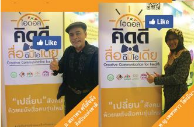
ดร.สุภาวดี ศรีวิเศษ อธิบดีกรมสุขภาพจิต