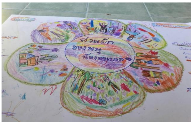
ผลการถอดบทเรียนเรื่องผ้าของนักเรียนระดับปฐมวัย

การถอดบทเรียนดังกล่าวจะทำตั้งแต่ระดับอนุบาล โดยในระดับอนุบาลคุณครูจะเป็นผู้สรุปตามที่นักเรียนได้แสดงความคิดเห็นและนักเรียนจะมีส่วนร่วมในการวาดภาพเพื่อสื่อสารในประเด็นต่างๆ กระบวนการถอดบทเรียนจึงเป็นกิจกรรมที่ทำให้ผู้มีส่วนร่วมในกิจกรรมทั้งผู้อำนวยการกิจกรรม (คุณครู) และผู้เข้าร่วมกิจกรรม (นักเรียน) ได้มีการแลกเปลี่ยนความคิดเห็น กระบวนการสื่อสารดังกล่าวสามารถสร้างลักษณะนิสัยของการเคารพความคิดเห็นของผู้อื่น และฝึกทักษะการคิดวิเคราะห์