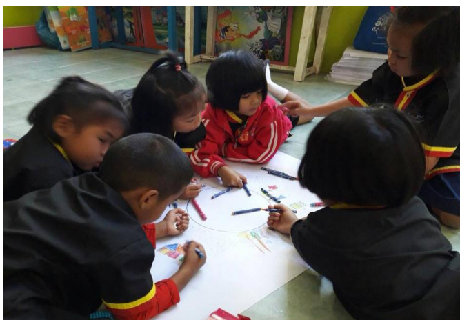
การสื่อสารขณะการถอดบทเรียนของนักเรียนระดับปฐมวัย

ผู้วิจัยวิเคราะห์ว่าการที่ผู้เรียนได้เรียนรู้ว่าตนเองได้เกิดความรู้จากสิ่งๆที่เรียนอย่างไร นอกจากจะเป็นการฝึกทักษะการวิเคราะห์แล้ว ยังเป็นการฝึกทักษะด้านการสื่อสารเพื่อแลกเปลี่ยนความคิดเห็น การเคารพในความคิดเห็นของผู้อื่นอีกด้วย