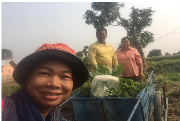
ครูและปราชญ์ชุมชนสอนเรื่อง “ผักในชุมชน”

เมื่อได้หัวข้อที่จะศึกษาแล้วนักเรียนจะมีส่วนร่วมในการนำเสนอรายชื่อปราชญ์ที่คาดว่าจะมีความสามารถถ่ายทอดความรู้ในสิ่งที่พวกตนอยากจะเรียนรู้ รวมทั้งรับบทบาทในการติดต่อประสานกับปราชญ์ที่ตนเป็นผู้นำเสนอ หากรายชื่อปราชญ์มีหลายคนในชั้นเรียนจะได้ร่วมพิจารณาเปรียบเทียบว่าในประเด็นที่จะเรียนรู้นั้น ปราชญ์ท่านใดมีความเหมาะสมมากที่สุด โดยยึดเสียงข้างมากเป็นหลัก