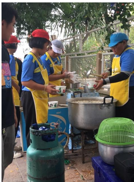
กระบวนการทำบะหมี่เกี่ยวได้ฝึกทักษะชีวิตให้กับนักเรียน

การสร้างทักษะประกอบอาชีพให้กับนักเรียนสามารถเกิดขึ้น เนื่องจากนักเรียนบางส่วนมีปัญหาทางครอบครัว ดังนั้นการที่นักเรียนมีทักษะในการประกอบอาชีพย่อมทำให้นักเรียนมีเครื่องมือในการเลี้ยงชีพต่อไป รวมทั้งยังเป็นการสร้างลักษณะนิสัยที่ดีในการทำงาน ได้แก่ ความขยัน อดทน ซื่อสัตย์ รับผิดชอบ กระตือรือร้น นอกจากนี้ การเข้าร่วมกิจกรรมระหว่างศึกษาอยู่ทำให้นักเรียนมีเงินจำนวนหนึ่งที่สามารถนำมาใช้จ่ายในชีวิตประจำวันได้