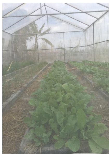
แปลงผักที่ใช้เป็นวัตถุดิบในการผลิตมะหมีเกี่ยวที่นักเรียนเป็นผู้รับผิดชอบ