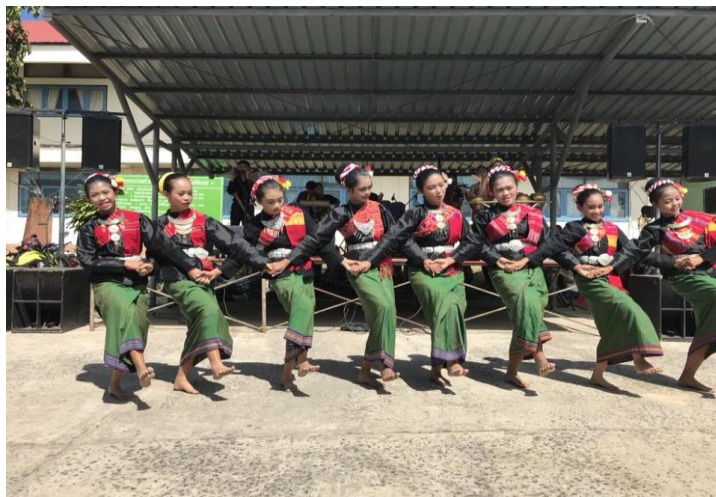
วงดนตรีสะไนใจเยอโรงเรียนเมืองคง (คงคาวิทยา)บูรณาการความรู้ภูมิปัญญาดนตรีพื้นบ้านเข้ากับการพัฒนาผู้เรียน

2) การสร้างทัศนคติในทางบวกว่ากิจกรรมพัฒนาผู้เรียนสามารถเชื่อมโยงเข้ากับตัวชีวิตทางการเรียนรู้ได้ทุกตัว ผ่านการประชุมชี้แจงในรูปแบบที่เป็นทางการ และการยกระดับการประเมินตัวชีวิตผ่านกิจกรรมดังกล่าวให้มีความน่าเชื่อถือขึ้น โดยออกแบบเป็นเอกสารการประเมินที่ลงนามโดยผู้อำนวยการซึ่งแสดงถึงการยอมรับว่าการประเมินดังกล่าวมีมาตรฐานในขณะเดียวกันก็ได้สร้างให้คุณครูผู้สอนเกิดความสุขในการทำงานออกแบบกระบวนการส่งเสริมการเรียนการสอน โดยการกำหนดให้ผู้สอนทำแผนการสอนที่มีความยาวประมาณ 1 หน้ากระดาษ A4 ที่ระบุประเด็นสำคัญเท่านั้นซึ่งเป็นการลดภาระงานด้านเอกสารของผู้สอน