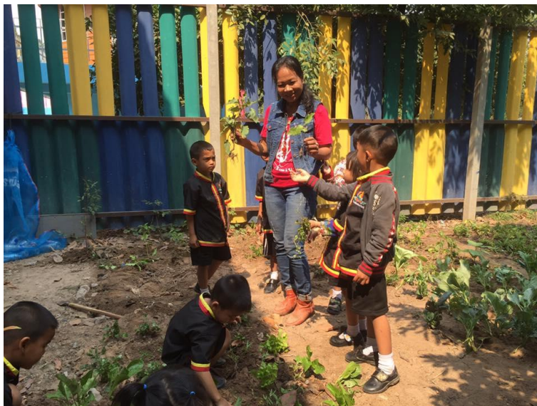
ครูสร้างแรงจูงใจในการเรียนรู้เรื่องผักให้กับนักเรียน

ดังนั้นครูซึ่งรับบทบาทการเป็นผู้อำนวยความสะดวกการเรียนรู้จะต้องมีทักษะในการสื่อสารเพื่อโน้มน้าวใจให้นักเรียนเกิดแรงจูงใจที่จะเรียนรู้ ซึ่งจากการศึกษาพบว่าการตั้งคำถามเพื่อให้นักเรียนได้แสดงความคิดเห็นเป็นเครื่องมือขับเคลื่อนที่สำคัญที่จะทำให้ให้นักเรียนเกิดการมีส่วนร่วมและทักษะในการคิดวิเคราะห์ รวมทั้งรูปแบบการสื่อสารสองทางตลอดกิจกรรมได้ส่งเสริมให้เกิดประสิทธิภาพในการเรียนรู้