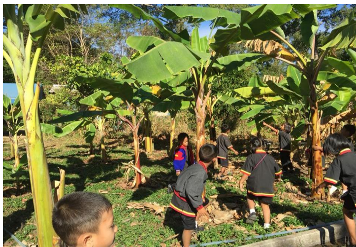
การเรียนรู้เรื่องผักสามารถขยายกิจกรรมไปยังผลไม้

อย่างไรก็ตามการกำหนดประเด็นที่จะศึกษานั้นครูจะมีกรอบของเรื่องที่จะศึกษา ซึ่งมีความสอดคล้องกับสาระการเรียนรู้ในแต่ละระดับชั้นเรียน ในขั้นตอนนี้ครูจะมีบทบาทในการสร้างแรงจูงใจให้นักเรียนอยากจะเรียนรู้ในประเด็นดังกล่าว