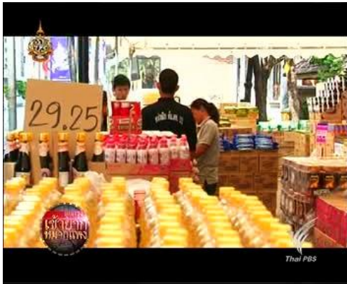
ภาพข่าวผลกระทบของน้ำท่วมที่มีต่อราคาสินค้า รายการลุยกรุง (ช่องไทยพีบีเอส) 18 พ.ย. 54

นานและมีปริมาณมากลงสู่ทะเลว่าได้ส่งผลเสียหายต่อระบบนิเวศน์และสัตว์น้ำอย่างมาก นอกจากนี้ยังพบปัญหาขยะที่เกิดจากความไม่ระบียบวินัยของผู้ที่นำรถไปจอดบนทางด่วนโทลล์เวย์