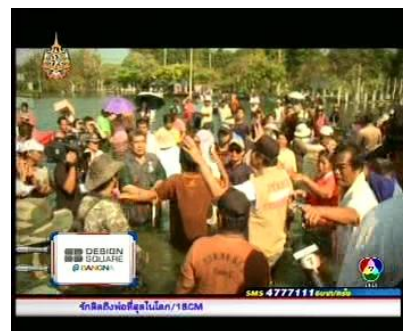
รายการประเด็นเด็ด 7 สี (16 พ.ย. 54)

ประชาชนผู้รอรับความช่วยเหลือ พบว่าโดยส่วนใหญ่ประชาชนผู้ประสบภัยมักถูกนำเสนอผ่านเรื่องราว ในลักษณะสะเทือนอารมณ์ ชีวิตความเป็นอยู่เป็นไปด้วยความยากลำบาก เช่น ประชาชนที่บ้านเรือนถูกน้ำท่วมขัง มานานนับเดือน เดินทางออกไปทำงานไม่ได้ ทำให้ขาดรายได้เนื่องจากส่วนใหญ่ประกอบอาชีพรับจ้างรายวัน หรือ ชีวิตความเป็นอยู่ของผู้อพยพในศูนย์พักพิงสถาบันการพลศึกษา จ.ชลบุรี บ้านถูกน้ำท่วมสูงถึงหลังคาบ้าน จึง อพยพมาอยู่ที่ศูนย์พักพิงดอนเมืองและต้องย้ายหนีน้ำมาอยู่ที่ศูนย์พักพิง จ.ชลบุรีเป็นแห่งที่สอง ซึ่งถ้าน้ำยังตามมา อีกคงย้ายหนีน้ำอีกไม่ไหวแล้ว