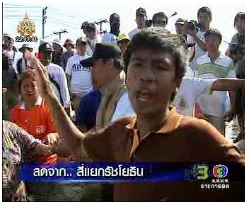
ภาพข่าวจากรายการข่าว 3 มิติ (ช่อง 16 พ.ย. 54)