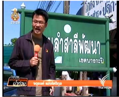
ภาพข่าวการสำรวจพื้นที่ที่รัฐบาลประกาศอพยพ รายการข่าววิฤตน้ำท่วม (ช่องไทยพีบีเอส 16 พ.ย. 54)