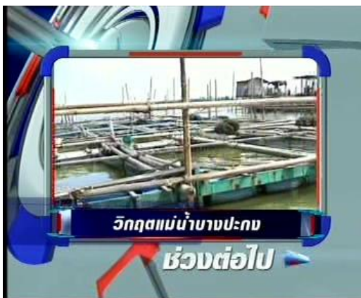
ภาพข่าวผลกระทบของน้ำท่วมที่มีต่อสภาพแวดล้อมของแม่น้ำบางปะกง รายการประเด็นเด็ด 7 สี (ช่อง 7) 16 พ.ย. 54