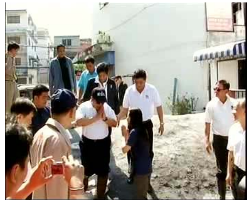
ภาพข่าวการจัดการปัญหาหน้าโดยรัฐบาล ภาพข่าว รายการจับประเด็นข่าวร้อน (ช่อง 5) 15 พ.ย. 54 ภาพข่าว รายการสถานีรวมใจช่วยภัยน้ำท่วม (ช่องสทท.11 18 พ.ย. 54)