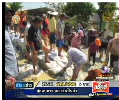
รายการข่าวชนคนข่าว (17 พ.ย. 54)

คนร้าย/ผู้ไม่ยอมเสียผลประโยชน์เพื่อส่วนรวม ส่วนใหญ่สถานีนำเสนอข่าว หรือภาพที่ประชาชนที่ รวมตัวกันออกมาหรือทำลายบีกแบ็ค ในลักษณะของกลุ่มคนที่มีอารมณ์ฉุนเฉียว ใจร้อน ขาดการรับฟังเหตุผล เห็น เพียงแต่ปัญหาของตนเองเป็นที่ตั้ง เช่น ชาวประชาชนในเขตลำลูกกา จ.ปทุมธานี เขตดอนเมือง เขตสายไหม ที่อยู่เหนือแนวคันกั้นน้ำออกมารื้อบีกแบ็ค เนื่องจากน้ำท่วมขังมานานนับเดือน แต่พื้นที่เขตได้แนวคันกั้นน้ำระดับน้ำ กลับลดลงอย่างต่อเนื่อง ดังตัวอย่างภาพข่าว