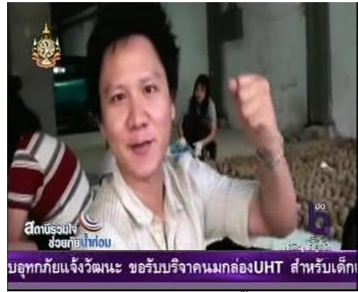
ภาพข่าวประชาชนช่วยกันปั้น EM Ball

จากรายการข่าว 3 มิติ (ช่อง 3 19 พ.ย. 54)