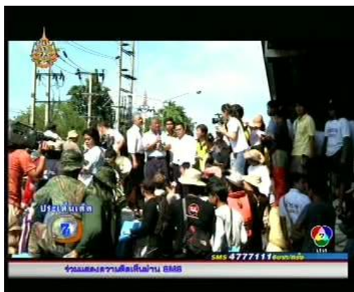
ภาพข่าวจากรายการประเด็นเด็ด 7 สี (ช่อง 7 14 พ.ย. 54)