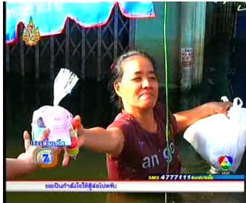
ภาพข่าวจากรายการประเด็นเด็ด 7 สี