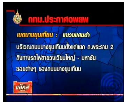
ภาพข่าวจากรายการข่าวข้นคนข่าว