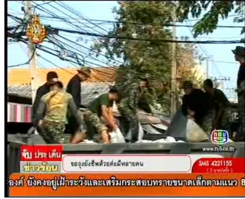
ภาพข่าวจากรายการจับประเด็นข่าวร้อน