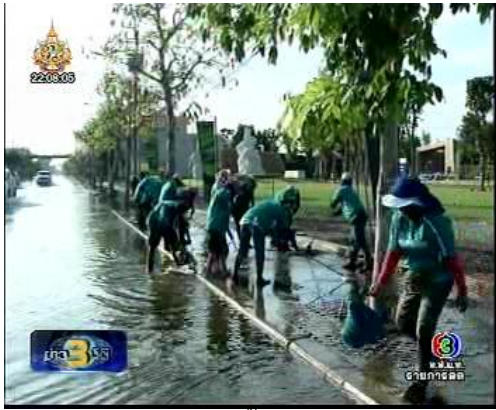
ภาพข่าวการฟื้นฟูถนนต่างๆ

จากรายการข่าว 3 มิติ (ช่อง 3 19 พ.ย. 54)