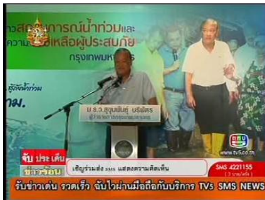
ภาพข่าวจากรายการจับประเด็นข่าวร้อน