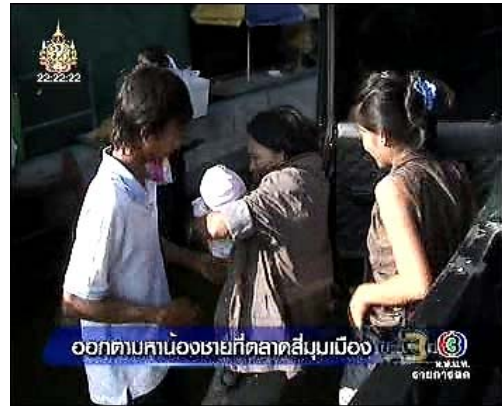
ภาพข่าวผู้ประสบภัยออกตามหาญาติที่หายตัวไปในช่วง น้ำท่วม รายการข่าว 3 มิติ (ช่อง 3) 13 พ.ย. 54