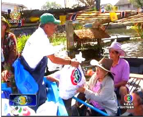
ภาพข่าวจากรายการข่าว 3 มิติ