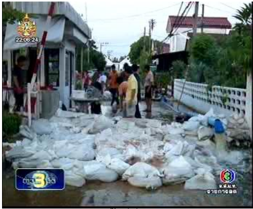
ภาพข่าวการสำรวจพื้นที่ที่รัฐบาลประกาศอพยพ รายการข่าว 3 มิติ (ช่อง 3 16 พ.ย. 54)