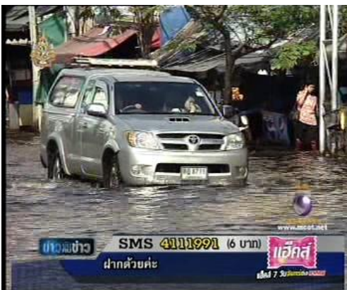
ภาพจากรายการข่าวขึ้นคนข่าว (ช่อง 9 15 พ.ย. 54)