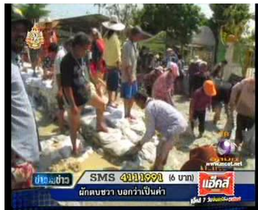
ภาพข่าวจากรายการข่าวขึ้นคนข่าว (ช่อง 9 17 พ.ย. 54)