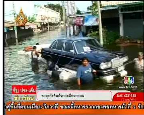
ภาพจากรายการจับประเด็นข่าวร้อน (ช่อง 5 14 พ.ย. 54)