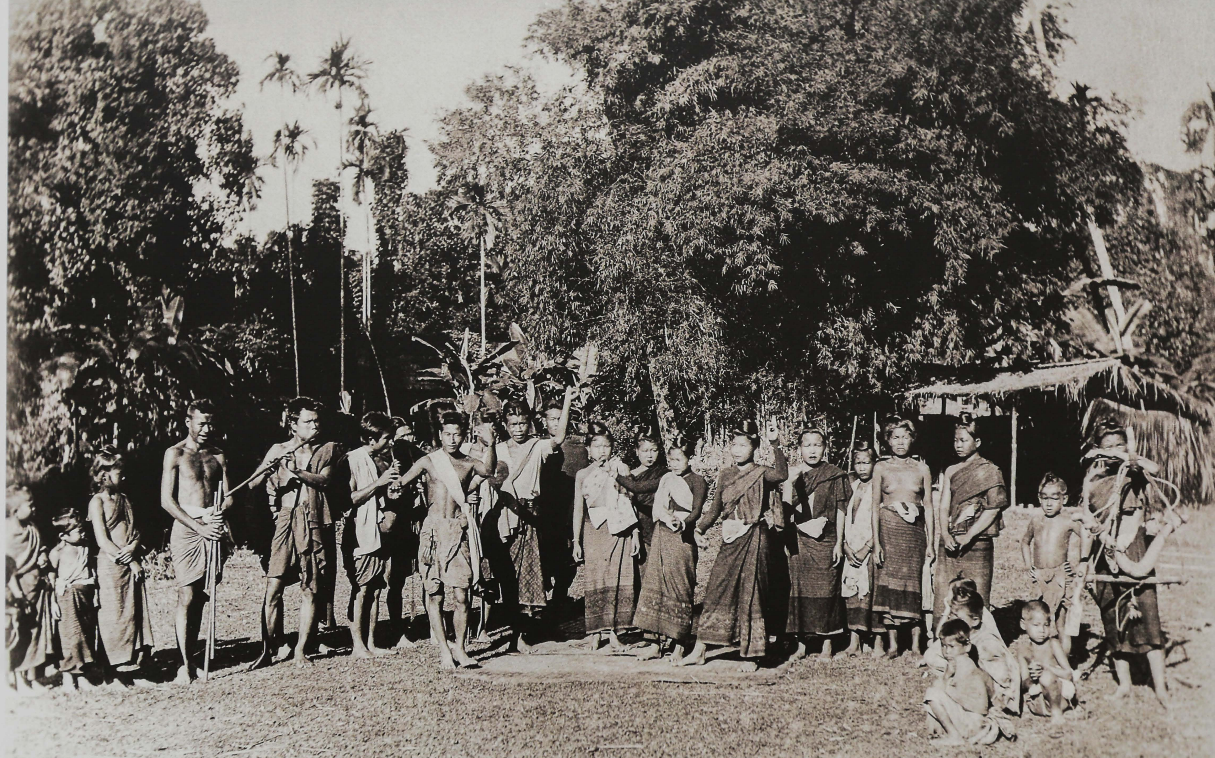
ภาพถ่ายคณะช่างขอชาวลับแล โดย J. Antonio ช่างภาพชาวต่างชาติที่สันนิษฐานว่าได้ตามเสด็จฯ รัชกาลที่ 5 เมื่อครั้งประพาสเมืองลับแล รศ.120 (วันที่ 24 ตุลาคม พ.ศ. 2444) และได้บันทึกภาพช่างขอที่มารับเสด็จกลุ่มนี้ไว้ ภาพนี้ไม่เพียงเป็นหลักฐานที่ชี้ให้เห็นถึงอัตลักษณ์ทางศิลปวัฒนธรรมของชาวลับแลเมื่อศตวรรษที่แล้ว หากยังเป็นภาพที่จุดประกายให้กลุ่มฟื้นฟูอัตลักษณ์ไทย-ยวนลับแล เกิดการรื้อฟื้นศิลปวัฒนธรรมพื้นบ้านอย่างเป็นรูปธรรม รวมทั้งการฟื้นฟูทำพ็อนนางโยน ทำพ็อนของสายตระกูลพระเมืองดั่ง ที่ใช้แสดงรับเสด็จรัชกาลที่ 5 ในตอนนั้นด้วย