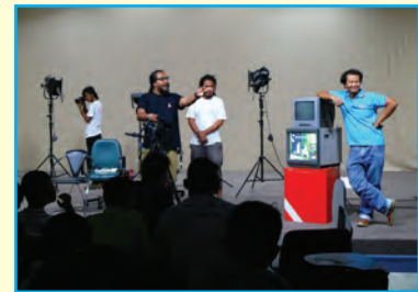
an independent filmmaker community ThaishortFilm