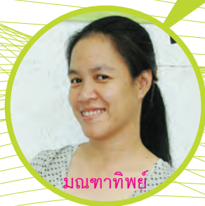
มณฑาทิพย์