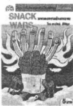
โลก ทารจวาร์ ชัยทิฏฐ