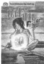
โลก ทิฆง แซ่เซียว