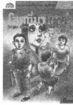
โลก เวียม เมฆาภณ