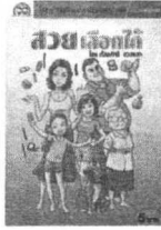
โลก เมธิงคำดี ดวงชด