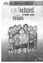
โลก ประมิตร ดวงชด