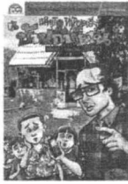
โลก ชัยงาร ดุฑเศร