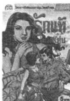
โลก ทีวีจาร์ เวียม