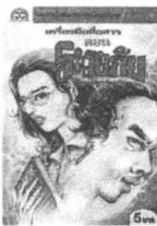
โลก เฉนิม ก้อนแก้ว