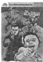
โลก ขรช่อ วุฒิชัย