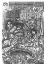
โลก วุฒิ ธาตุธา