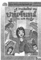
โลก ตงาทิ ศิวธา