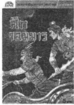
โลก ตงาทิ ปางปรังษา