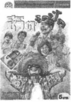
โลก เฉนิม อัครชฎ