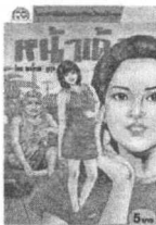
โลก ขรเมฆ วุฑฐ