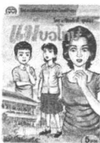
โลก เมธิงคำดี ดุฑดอง