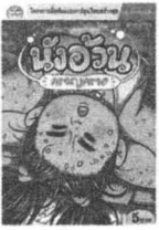
โลก ธง นาคปรุง