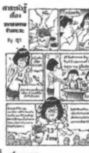
โดย ชานี อิกษิภาจุฑาภรณ์