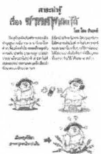
โดย โธม ชันวารี