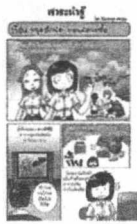
โดย ชานี อิกษิภาจุฑาภรณ์