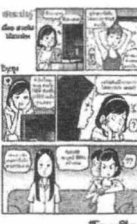
โดย ชานี อิกษิภาจุฑาภรณ์