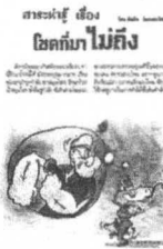
โดย สนิทนา รักษางงษ์โกทา