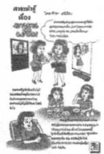
โดย ชานี อิกษิภาจุฑาภรณ์