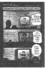
โดย ชานี อิกษิภาจุฑาภรณ์