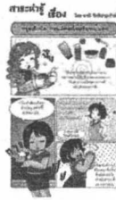
โดย ชานี อิกษิภาจุฑาภรณ์