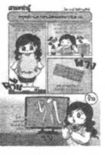
โดย ชานี อิกษิภาจุฑาภรณ์