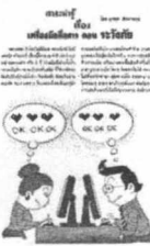
โดย ชานี อิกษิภาจุฑาภรณ์