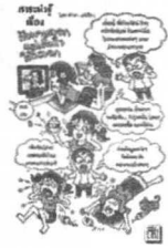
โดย ชานี อิกษิภาจุฑาภรณ์