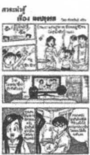
โดย ชานี อิกษิภาจุฑาภรณ์