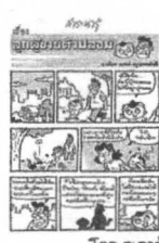
โดย ณรงค์ จตุจจรรมโทธิ