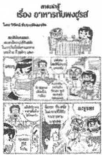
โดย วิวัฒน์ ชื่นองษ์พานิช