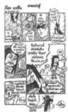
โดย ชานี อิกษิภาจุฑาภรณ์