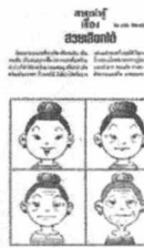
โดย ชานี อิกษิภาจุฑาภรณ์