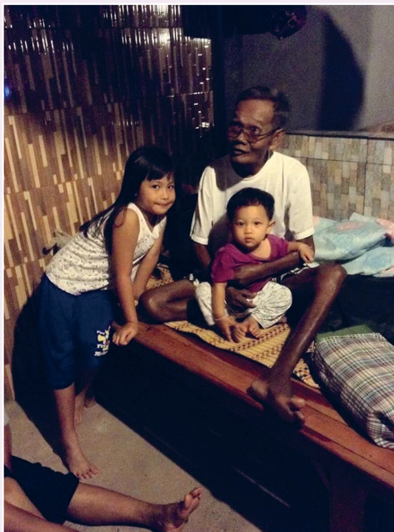
ช่วงที่นั่งคุยกันครับ

ต้องคอยหาโอกาส ช่วงพอนั่งเหม่อ ให้เข้าไปช่วยคุย ผมคุยเริ่มก่อน แล้วก็ปล่อยให้พ่อพูด พ่อก็จะเล่าอดีตที่เคยผ่านๆ มาให้ผมฟัง ยิ่งทำให้เราเข้าใจพ่อมากขึ้นครับ