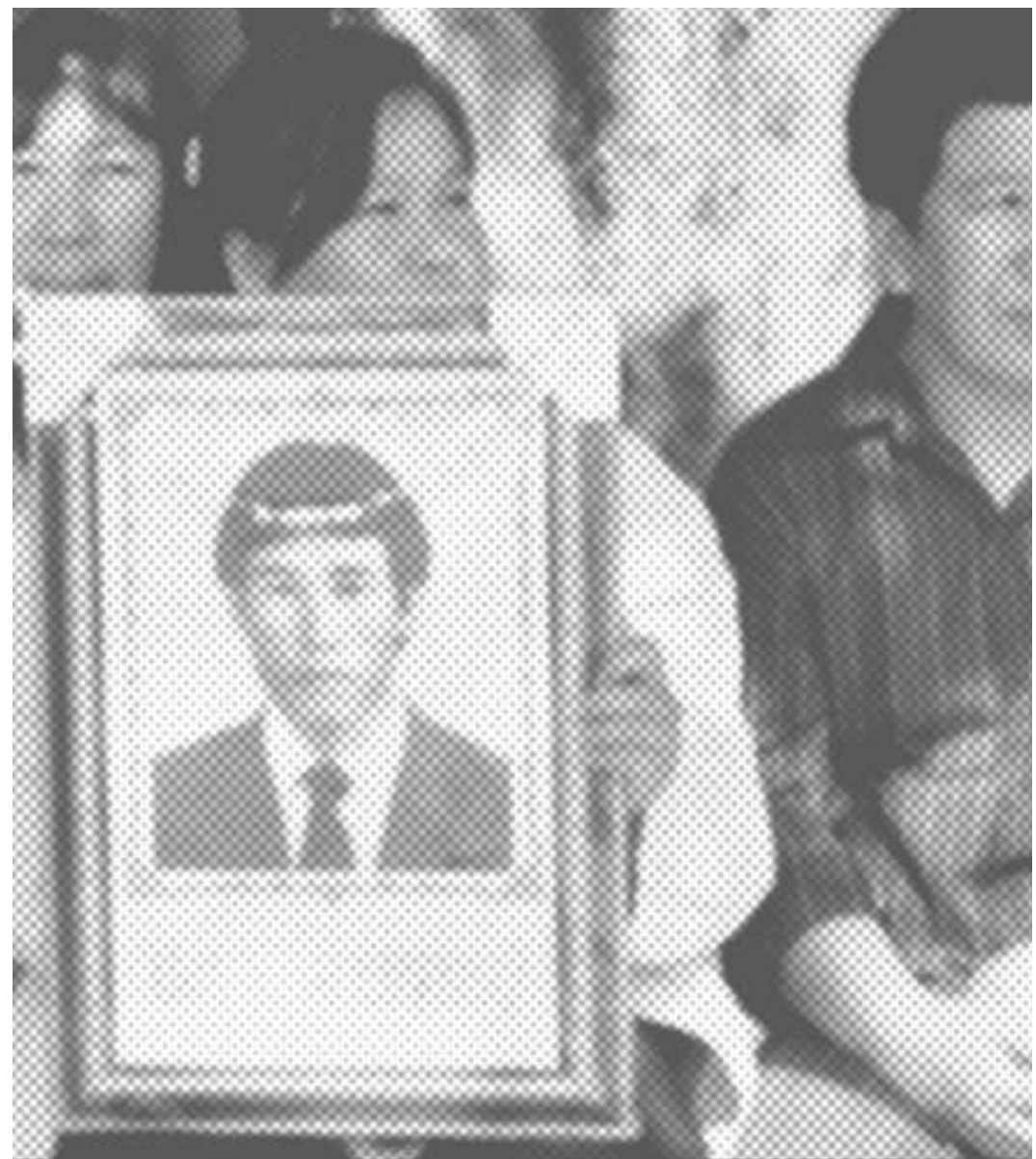
ชาวสวนลำไย กิ่งอำเภอเวียงหนองล่อง ลำพูน ทำกินในที่ดินเดิมของชุมชน ต่องโทะษามเสี่ยชีวิตในคุก