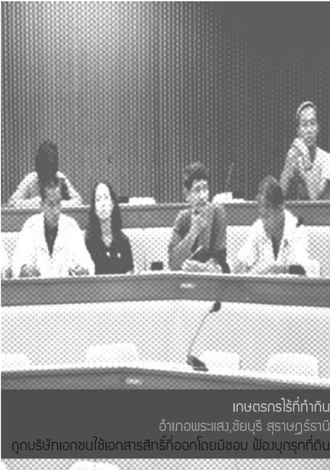
เกษตรกรไร้ที่กำกับ อำเภอพระแสง, ชัยบุรี สุราษฎร์ธานี ถูกบริษัทเอกชนใช้เอกสารสิทธิ์ที่ออกโดยมิชอบ ฟ้องบุกรุกที่ดิน