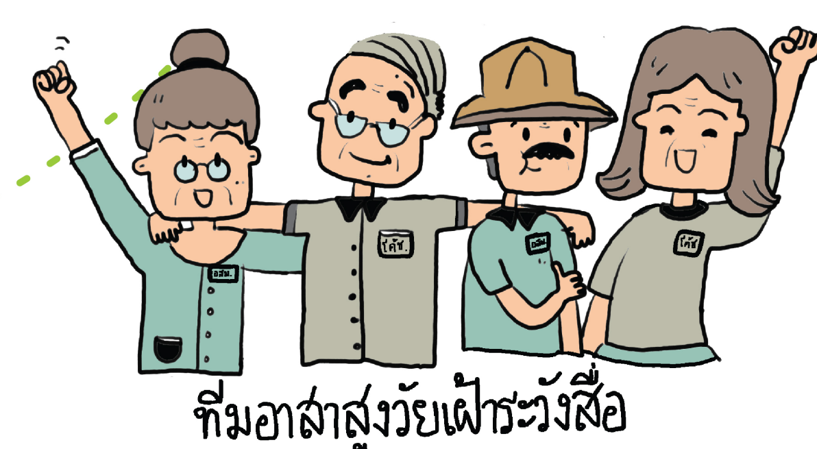
ทีมอาสาสูงวัยเฝ้าระวังสื่อ

จัดทีมอาสาสูงวัยเฝ้าระวังสื่อ ทำหน้าที่เป็นโค้ช ชี้แนะกันเอง